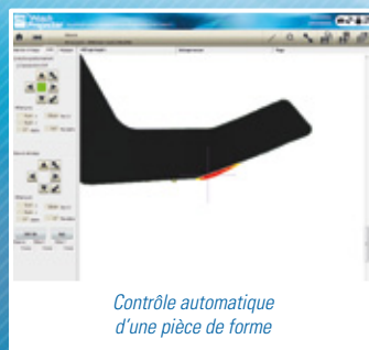
Contrôle automatique d'une pièce de forme