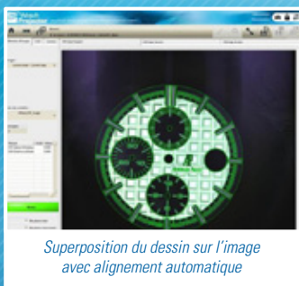
Superposition du dessin sur l'image avec alignement automatique