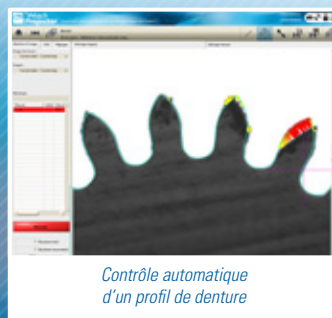
Contrôle automatique d'un profil de denture